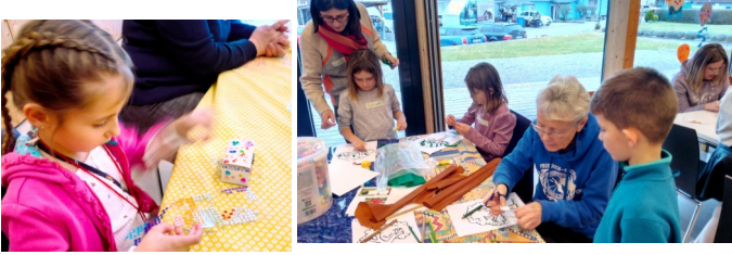
Die Schatzkästchen sind der Clou!