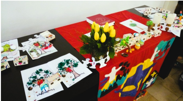
Was gebastelt wurde, wird zum Altar gebracht...