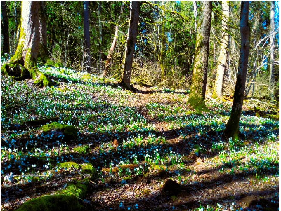
Märzenbecher am Wartenberg